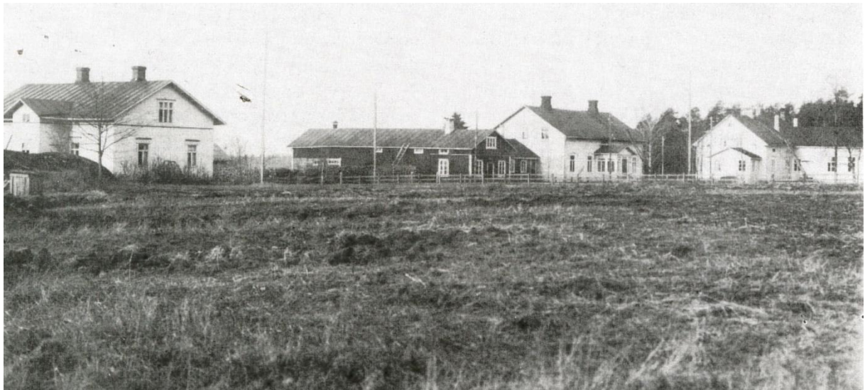
Skolhusen i Kila, fotograferade 1926. Den första skolan i Karis kommun grundades i Klockars karaktärsbyggnad, som ses i mitten av bilden.